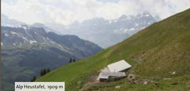
Alp Heustafel, 1909 m