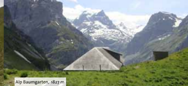
Alp Baumgarten, 1827 m