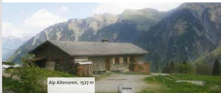
Alp Altenoren, 1527 m