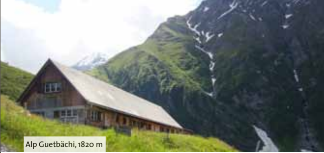
Alp Guetbächi, 1820 m