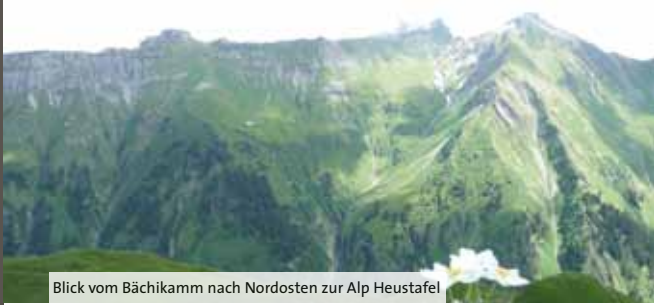
Blick vom Bächikamm nach Nordosten zur Alp Heustafel