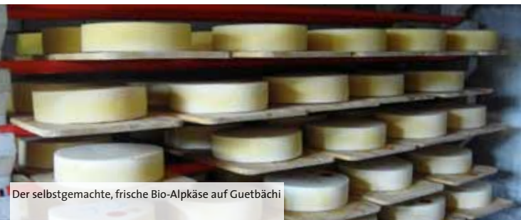
Der selbstgemachte, frische Bio-Alpkäse auf Guetbächi