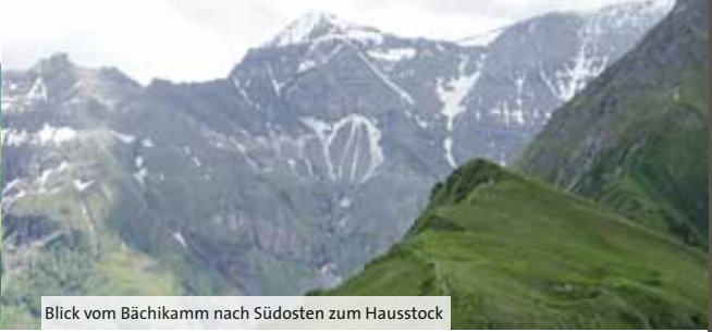
Blick vom Bächikamm nach Südosten zum Hausstock

1 Aufstieg Mit dem Taxi fahren wir vom Bahnhof Linthal bis Obbort 2 . Damit haben wir bereits 400 Höhenmeter bezwungen und sind erst noch dem Marsch auf dem Asphalt ausgewichen. Nun geht's aber endgültig zu Fuss weiter, 770 Meter bergauf, erst im Wald und dann über die Alpweide. Langsam tauchen wir in eine andere Welt ein: der Bach erzählt uns seine Geschichten, die Blumen am Wegrand winken uns zu. Die Luft wird würziger, es riecht nach Alp. Kuhglocken begrüßen uns, der Sennhund streicht uns um die Beine.