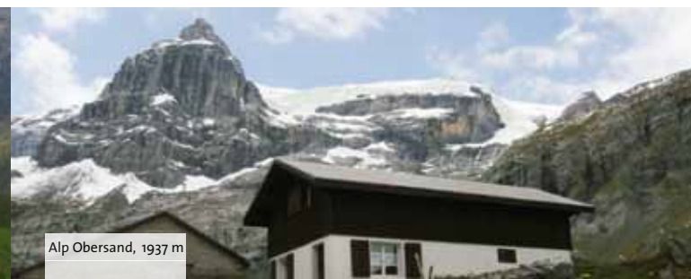
Alp Obersand, 1937 m